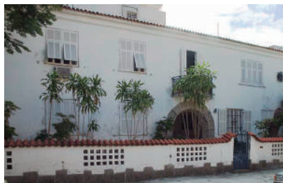
Rua Roquete Pinto, 07