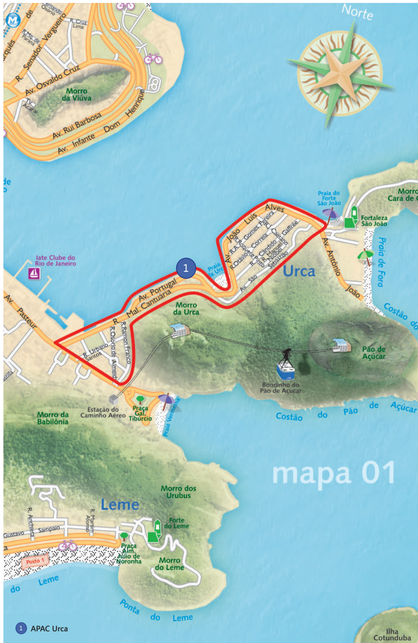
Imagem sem valor legal. Para informações consulte o IRPH.