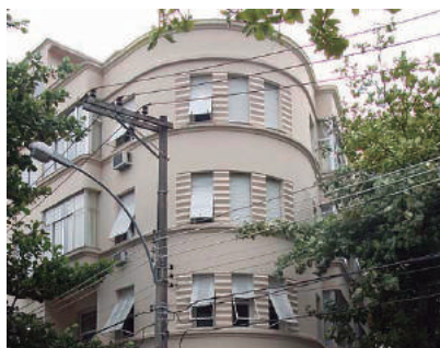
Rua Luiz Alves, 136