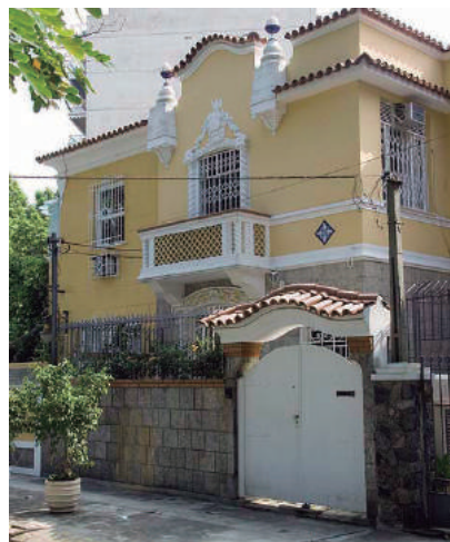
Rua Odílio Bacelar, 27