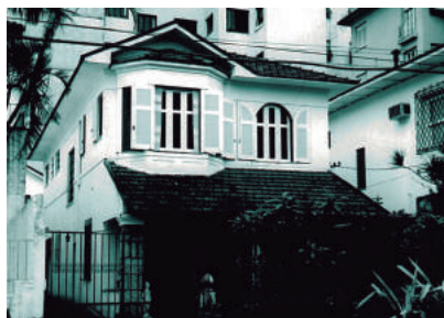
Rua Candido Gaffree, 28

Constituído por edificações com telhados expressivos, em geral com a inclinação das águas bem acentuadas; há presença de sótãos, mansardas, águas furtadas; nas fachadas é comum a simulação de enxaimel ou paredes de pedra resguardando varandas. As esquadrias são em geral de madeira com folha de vidro.