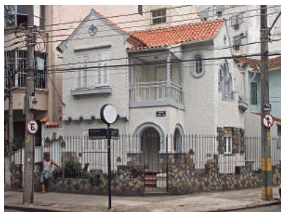
Av. Pasteur, 405