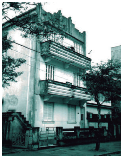
Rua Candido Gaffree, 27

Bastante íntegro: Esta categoria é o agrupamento dos prédios de apartamentos. As fachadas variam bastante e encontram-se elementos dos outros grupos, porém para responder ao programa do prédio, e fora alguns elementos decorativos aplicados às fachadas, não diferem muito entre si no que se refere à volumetria. O que há de mais expressivo neste grupo são as portarias, as varandas e os vãos.