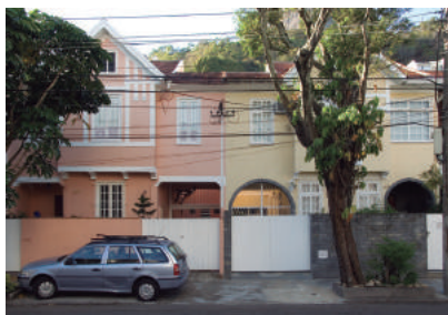
Rua Candido Gaffree, 124/126