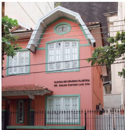
Rua Ramon Franco, 112