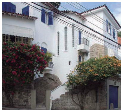
Av. São Sebastião, 170