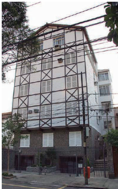
Rua Candido Gaffree, 119