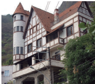
Rua São Sebastião, 12

Rua Urbano Santos: 38, 61 (incluído através do Decreto "N" nº 16783 de 29/6/1998)