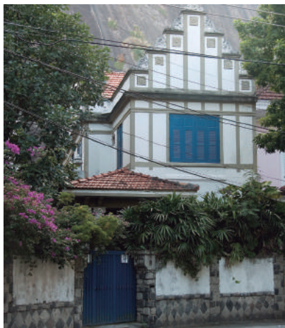
Rua Felix Laramnjeiras, 08