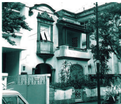
Rua Candido Gaffree, 23

Casas com muitos elementos decorativos nas fachadas: cercaduras imitando trabalhos em cantaria guarnecendo os vãos, azulejarias, colunas, cornijas e faixas lombardas. Os telhados são movimentados, com vários planos e com beirais expressivos. Presença de jardineiras e balcões em fachadas revestidas com reboco trabalhado em relevo. Utilização acentuada de madeira trabalhada guarnecendo varandas, vãos, além das esquadrias cuidadosamente desenhadas. Há movimento na composição dos volumes. Existência de pequenas torres.