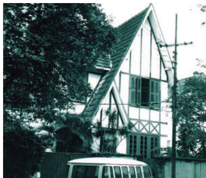
Rua Candido Gaffree, 89