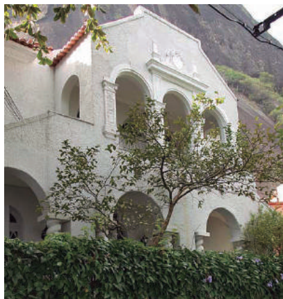
Av. Portugal, 466

Rua Almirante Gomes Pereira: 11 Avenida João Luiz Alves: 154, 218 Rua Joaquim Caetano: 60 Rua Marechal Cantuária: 162, 168 Rua Odílio Bacelar: 30, 48 Rua Osório de Almeida: 18; 07, 35 Rua Otávio Corrêa: 34, 80 Av. Pasteur: 377, 399, 433 Av. Portugal: 466 Avenida São Sebastião: 236 Rua Urbano Santos: 20, 22, 26, 50; 09, 13, 15, 17