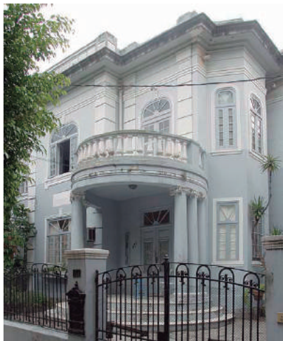
Av. Pasteur, 377