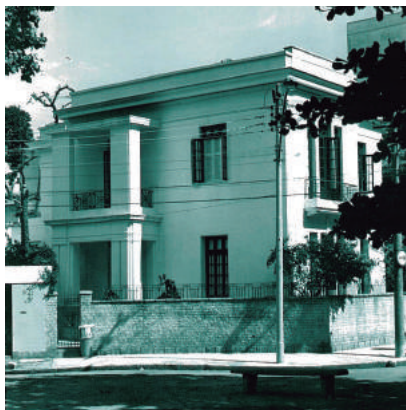
Rua Odilo Bacelar, 30

Encontram-se neste grupo os prédios com elementos Art-Deco ou com elementos decorativos mais sofisticados influenciados pela arquitetura clássica. As fachadas em geral são muito decoradas, as esquadrias são interessantes por seu fino trabalho, com presença constante de delicadas venezianas. A serralheria é muito expressiva, tanto nos muros e portões ou quando aparecem nos vãos ou ainda, guarnecendo pequenos balcões.