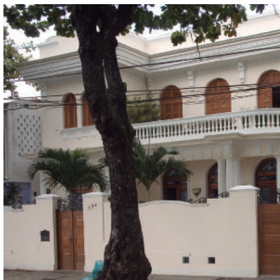
Rua João Luiz Alves, 154