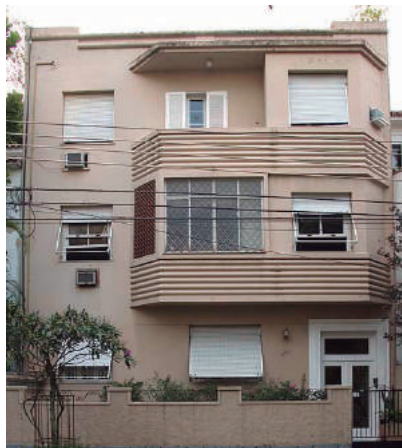
Rua Candido Gaffree, 173

Rua Almirante Gomes Pereira: 76, 130, 158; 51, 67 Rua Cândido Gaffrée: 18, 36, 86, 88, 178; 27, 95, 119, 165, 173, 205 Avenida João Luiz Alves: 52, 76, 88, 136, 282 Rua Joaquim Caetano: 6; 25, 59, 73 Rua Manuel Niobei: 18; 47, 53, 57, 61, 63 Rua Marechal Cantuária: 60, 64, 102 Rua Odílio Bacelar: 15 Rua Osório de Almeida: 34, 62, 80; 75 Rua Otávio Corrêa: 94, 420, 448; 211, 259, 273 Avenida Pasteur: 403, 409 Avenida Portugal: 484, 502, 534, 544, 564, 584, 666, 838, 858, 936, 986 Rua Ramon Franco: 6/8, 70/72/74/76/78/80/82/84/86; 75 Rua Roquete Pinto: 60, 66, 70, 86, 88; 17, 35 Av. São Sebastião: 136, 160; 141 Rua Urbano Santos: 82, 84