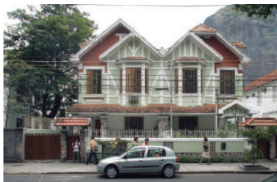
Av. Pasteur, 445/449