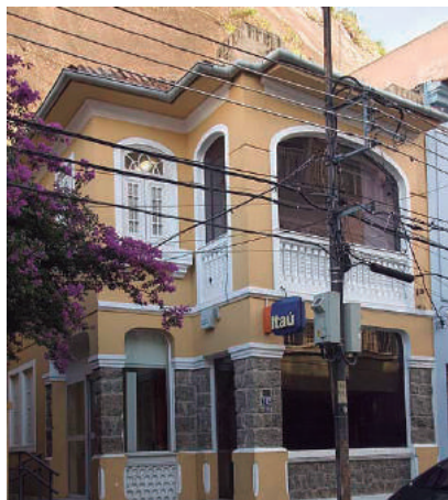
Rua Marechal Cantuárai, 162