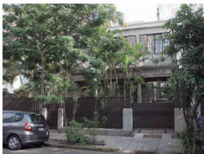
Rua Otávio Corrêa, 80