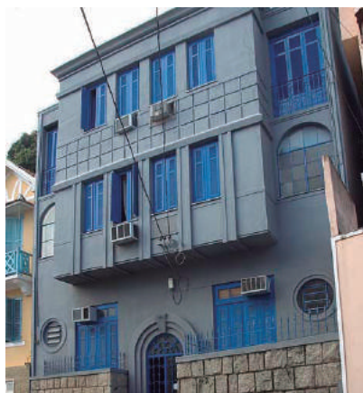
Rua São Sebastião, 160