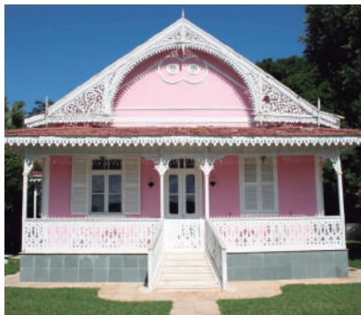
Chalet , na Praia das Gaivotas, 44

Edificação pitoresca de inspiração romântica. Destacam-se os lambrequins na fachada. Conhecida como Casa da Moreninha.