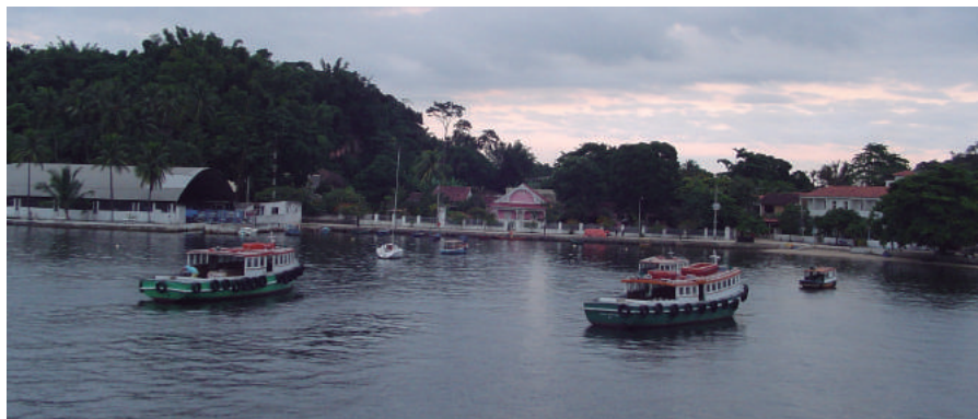
Praia das Gaivotas

Segundo Maurício de Abreu, no século XIX, as fazendas mais próximas do centro da cidade começaram a ser retalhadas em chácaras, que, no início, foram reservadas às atividades de fim de semana das classes dirigentes, transformando-se, mais tarde, em local de residência permanente. Paquetá seguiu a mesma linha, aos poucos suas terras foram subdivididas através de compra ou de herança. Depois disso, as terras foram sendo fracionadas em diversas chácaras como: a do Castelo, a dos Coqueiros, a do Vinte, a dos Cajueiros, a Hill-Crest, uma sem nome (entre as ruas Padre Juvenal e Maestro Anacleto), a da Moreninha, a Chácara Amarela e a Chácara do Marechal, entre outras. Ao sul da ilha, a única chácara cujos contornos chegaram praticamente intactos aos nossos dias foi a chácara do Morro da Cruz, atual Parque Darke Mattos.