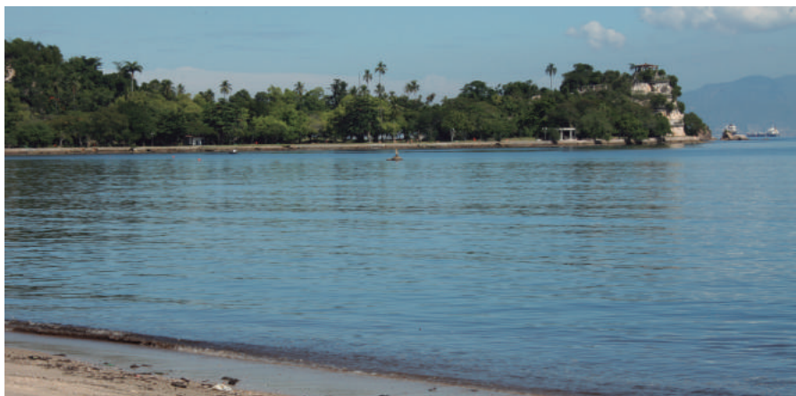
Praia José Bonifácio