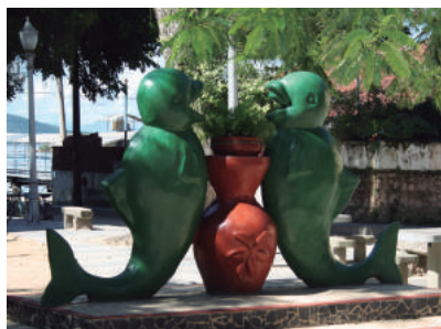
Esculturas, fontes, bancos e demais elementos construtivos, paisagísticos e de mobiliário urbano de autoria de Pedro Bruno

De autoria do pintor Pedro Bruno, morador local, estão localizados em diversos logradouros públicos da ilha de Paquetá.