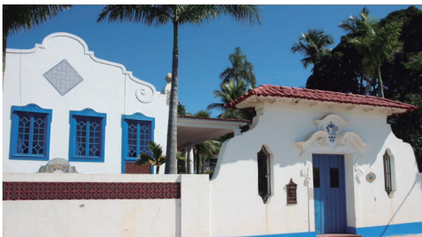
Praia Grossa, 26

A partir, principalmente, do início do século XX e até meados da década de 1940, muitas grandes residências da classe média foram construídas na ilha, principalmente nos lotes de frente para o mar da Baía de Guanabara. Apresentando traços de diversos gostos arquitetônicos: normando, eclético e, predominantemente, neocolonial, tais casarões são referência arquitetônica em Paquetá. Estes se caracterizam por serem de até dois pavimentos, afastados das divisas e, muitas vezes, possuírem edículas que serviam à moradia de caseiros, zeladores, empregados ou garagem para barcos.