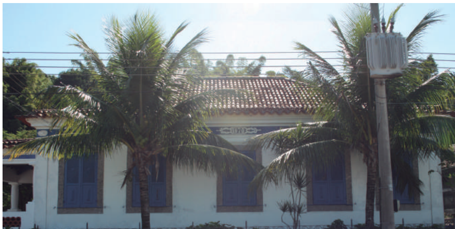
Praia das Gaivotas, 796

Durante o século XIX, as fazendas de Paquetá foram divididas em chácaras que, aos poucos, foram também sendo fracionadas em lotes menores. Ainda assim, algumas poucas edificações permaneceram, apesar do loteamento da propriedade original. Essas construções são geralmente térreas ou sobre porões e guardam características arquitetônicas que remetem ainda a casas tradicionais portuguesas, embora devido aos anos, já possam ter sofrido modificações.