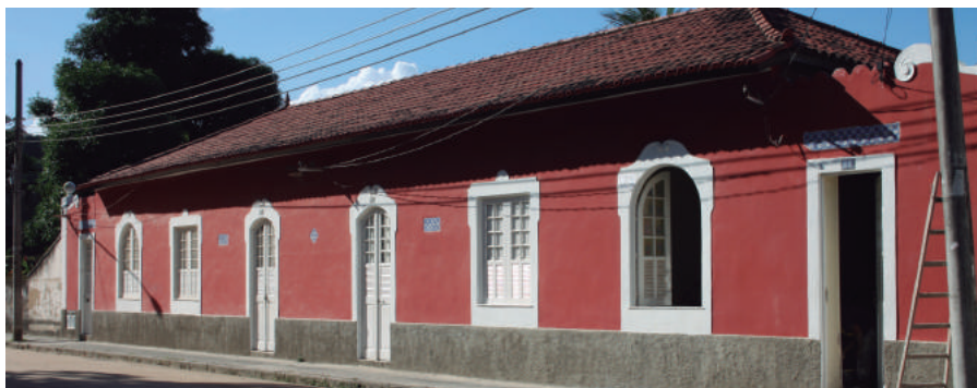
Rua Príncipe Regente, 44, 46 e 48