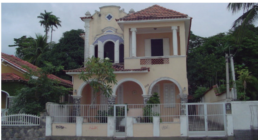
Praia dos Tamoios, 349