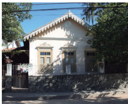
Rua Manuel Macedo, 429