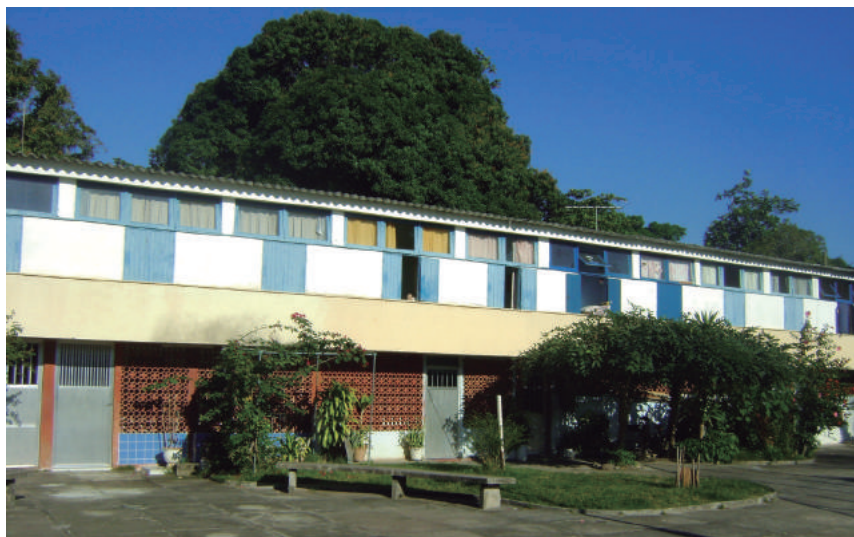
Conjunto arquitetônico na Rua Padre Juvenal, 4

De autoria do pintor Pedro Bruno, morador local, estão localizados em diversos logradouros públicos da ilha de Paquetá.