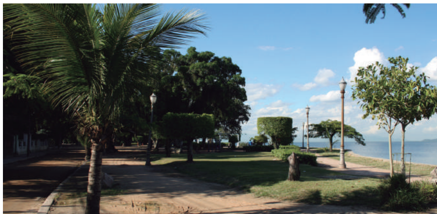
Praia das Gaivotas, 190