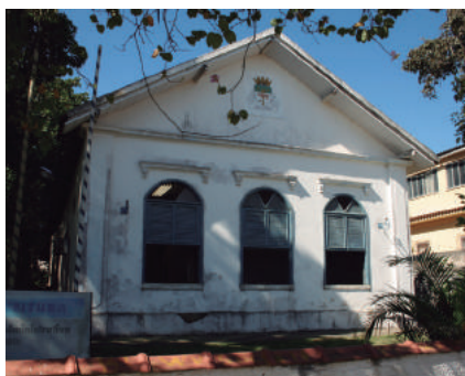
Praia José Bonifácio, 127

Talvez devido ao seu caráter romântico, os chalés se tornaram uma identidade da Ilha dos Amores. Muitos desses podem ser vislumbrados por toda a ilha, entre os quais, a popular Casa da Moreninha, tombada, uma referência ao conhecido romance de Joaquim Manuel de Macedo. O chalé é normalmente uma construção térrea, com telhado de duas águas bastante inclinado à empena da tesoura voltada para a fachada frontal.