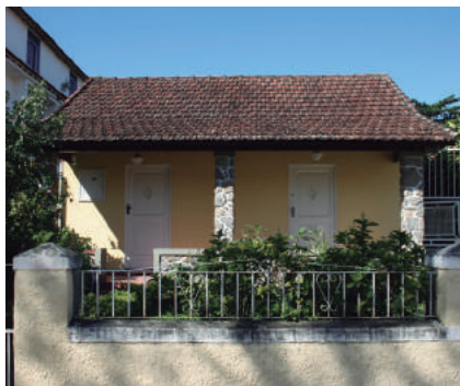
Rua Maria Freire, 23

É correto afirmar que as casas térreas, de arquitetura singela, são a tipologia mais comum da ilha. As mais antigas, de pouca ornamentação e chamadas do tipo porta e janela, datam do século XIX e abrigaram provavelmente famílias nativas da ilha que viviam em função da pesca ou da atividade caieira. Posteriormente, no final do século XIX e princípio do XX, surgem residências com características que remetem ao gosto eclético, influenciadas pela arquitetura do centro da capital do país. Ainda algumas residências com influência da arquitetura historicista, principalmente do gosto neocolonial, surgiram durante as décadas de 1920 e 1930.